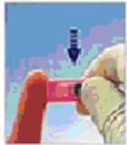
Щільно притисніть ланцет до вибраного місця та натисніть кнопку.