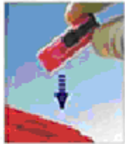
Угнізуйте ланцет у відповідному контейнері.