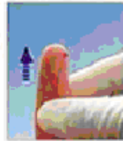
Стискайте палець до появи краплі крові.