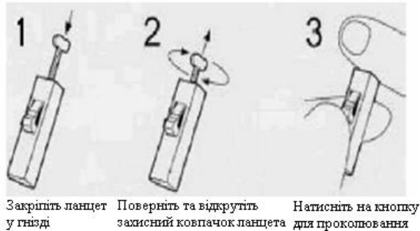
1. Закріпіть ланцет у гнізді. 2. Поверніть та відкрутіть захисний ковпачок ланцета. 3. Натисніть на кнопку для проколівання.

Не відкривайте пакет поки ви не готові проводити тестування.